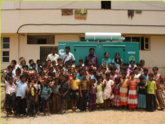
CCH-Kinder (vor dem neuen Generator)