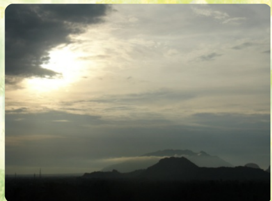
Die Umgebung der Schule

„Die Güte des HERRN ist's, daß wir nicht gar aus sind; seine Barmherzigkeit hat noch kein Ende, sondern sie ist alle Morgen neu, und deine Treue ist groß.“ –Klagelieder 3,22-23