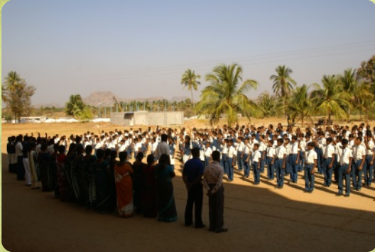
Morgenversammlung der Schule (CMHSS)