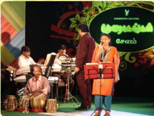
Schüler der CMHSS haben an einem Gesangswettbewerb eines christlichen TV-Senders teilgenommen