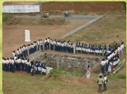
Grundsteinlegung für die Brunnenmauer