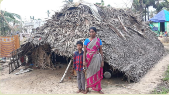
Eine Familie vor dem, was der Zyklon von ihrem Haus übrig-gelassen hat.