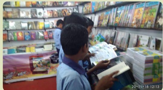
Bei der Buchausstellung hatten die Schüler und Schülerinnen die Möglichkeit, in hunderte Bücher reinzuschnuppern.

Selig sind die Barmherzigen, denn sie werden Barmherzigkeit erlangen. – Matthäus 5,7