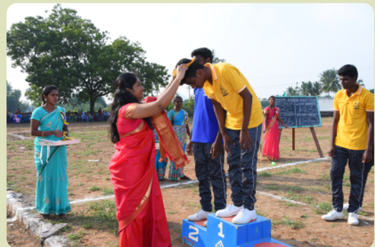
Siegerehrung beim Sporttag.

Die älteren Schüler der Christopher Matriculation Higher Secondary School