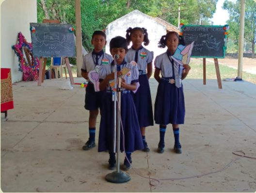
Ständchen für die Republik am Unabhängigkeitstag.