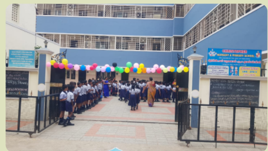
Wiedereröffnung der CNPS nach der Pandemie.

D a die Schule erst nach der Pandemie wieder begann, haben wir verschiedene Maßnahmen ergriffen um die Kinder akademisch auf den