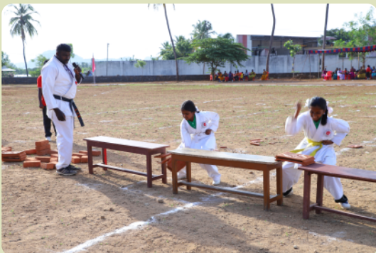
Die Karatemannschaft der Mädchen beim durchschlagen von Ziegeln.