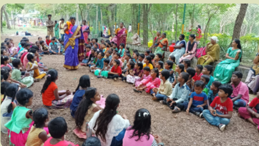
Auch ein Ausflug in den Wald wurde bei der Ferienbibelschule unternommen.

eine persönliche Beziehung zu ihm aufzubauen. Alle Mitarbeiter erhielten einen Weihnachtspflaumenkuchen und eine Grußkarte.