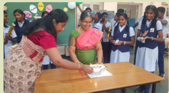
... Kuchen für die Lehrerinnen am Teacher`s day.

Selig sind die Barmherzigen, denn sie werden Barmherzigkeit erlangen. – Matthäus 5,7