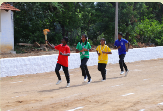
Einzug der Flamme ins Stadion beim Sporttag.

neuesten Stand zu bringen. Wir begannen das Schuljahr 2023-24 mit einem Einführungstag. Die Lehrer wurden vorgestellt und die Kinder motiviert, aktiv am Unterricht teilzunehmen. Alle Klassenzimmer wurden mit audiovisuellen Geräten ausgestattet, um das digitale Lernen zu unterstützen. Für die Kinder gab es verschiedene Aktivitäten, bei denen sie durch eigenes Tun lernen (learning by doing) und den Eltern ihr Wissen präsentieren konnten. Zwei dieser Aktivitäten waren die "Student Led Conference" (SLC) und das "Student Led Movement" (SLM). SLCs waren eine Ausstellung von Lernmodellen und die Präsentation von Diagrammen, um Eltern und Besuchern zu zeigen, was die Schüler gelernt haben. SLMs waren Kundgebungen und soziale Sensibilisierungsprogramme, um die Gesellschaft über Umweltschutz und persönliches Wohlergehen aufzuklären. Außerdem feierten die Kinder verschiedene Tage von nationaler Bedeutung wie den indischen Unabhängigkeitstag und den Tag des Lehrers (Teacher's Day). Am Teacher's Day ehrten die Kinder ihre Lehrer und das gesamte nicht unterrichtende Personal der Schule. Am indischen Unabhängigkeitstag wurde eine Flagge gehisst und es gab kulturelle Aktivitäten.