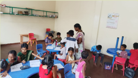
Mit vollem Elan beim Basteln.