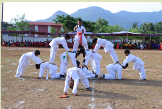
Akrobatik pur bei der Pyramide.