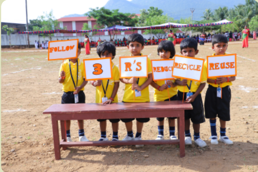
Umweltbildungsprogramm am Sporttag: "Please use 3 R`s: Reduce, Recycle, Reuse"