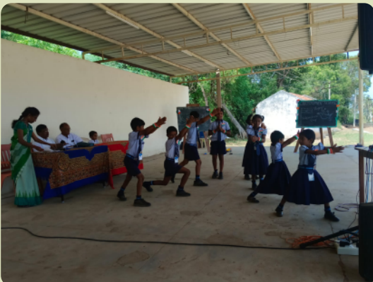
Kulturprogramm am Unabhängigkeitstag: Tanzaufführung.