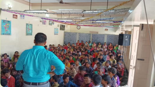
Volles Haus bei der Ferienbibelschule.