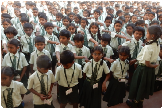
Morgenversammlung vor Schulbeginn