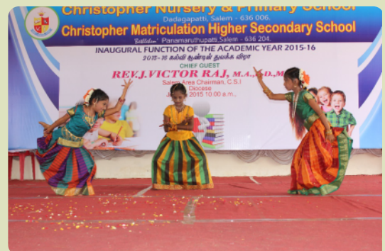
Ein traditioneller Willkommenstanz, aufgeführt von einigen unserer Schulkinder

Selig sind die Barmherzigen, denn sie werden Barmherzigkeit erlangen. – Matthäus 5,7