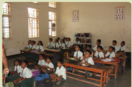
Blick ins Klassenzimmer. Leider gibt es immer noch nicht genügend Tische und Bänke für alle Kinder

Selig sind die Barmherzigen, denn sie werden Barmherzigkeit erlangen. – Matthäus 5,7