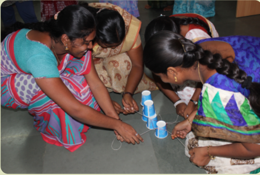
Teamarbeit (Verantwortungsbewusstsein, Mitarbeit & Vertrauen)