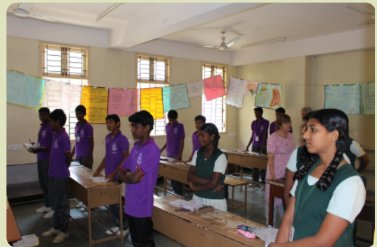
Klassenzimmer während des Unterrichts (In Indien stehen die Kinder, bis der Lehrer ihnen erlaubt sich zu setzen)