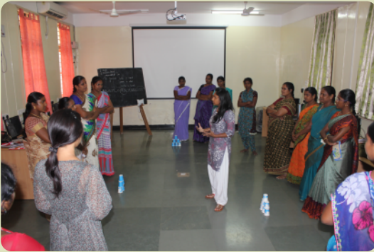
Gemeinsam sind wir stark