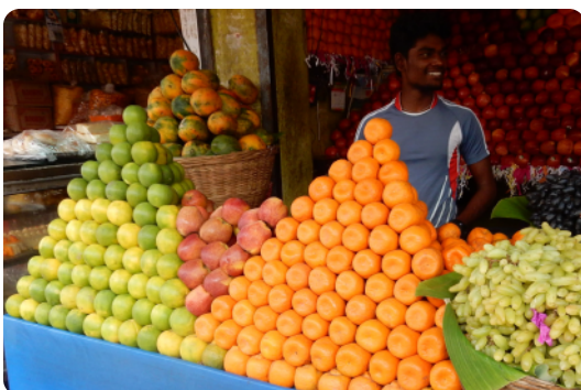
Obstladen an der Straße