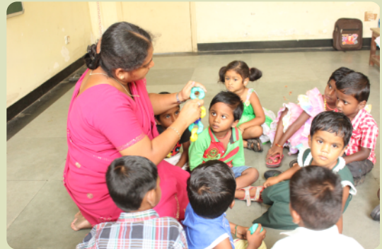
Lehrerin mit Kindergartenkindern