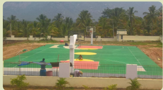
In Panamarathupatti gibt es jetzt einen Basketballplatz, auf dem die Schüler und Heimkinder spielen können.

Selig sind die Barmherzigen, denn sie werden Barmherzigkeit erlangen. – Matthäus 5,7