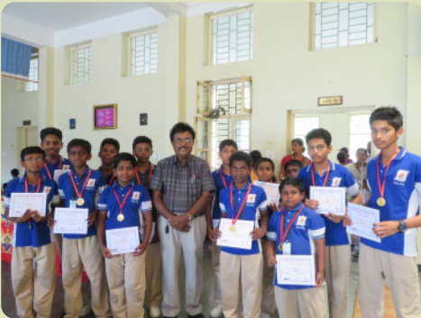
Schüler, die mit Auszeichnung abgeschlossen haben. Gratulation!