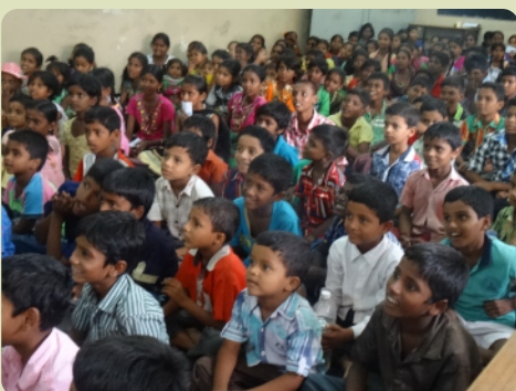
Ein kleiner Teil der Teilnehmer der Ferienbibelschule