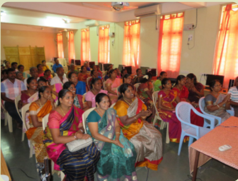
Die Lehrer beim Lehrer-Dankes-Treffen