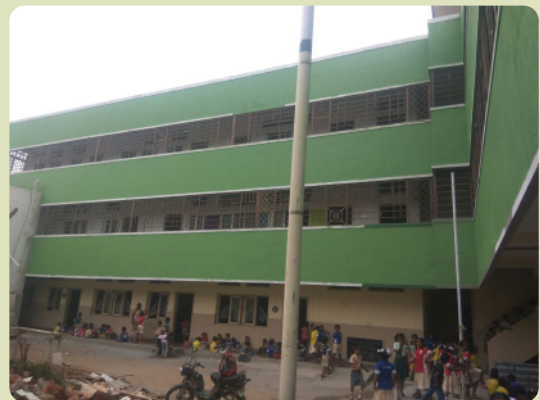
Die Schule in Salem konnte endlich aufgestockt werden.

D er Hochsommer in Indien umfasst drei Wochen im Mai, wenn die Temperaturen über 40, manchmal über 50°C steigen. In den letzten Jahren dauerte die Hitze noch viel länger an. Es gibt sehr wenig Regen und als Folge davon geringe Ernten, ausgetrocknete Brunnen, kein Trinkwasser usw. Wir brauchen SIE: Vereinen Sie Ihre Herzen mit uns im Gebet für mehr Regen – denn für Gott ist nichts unmöglich!