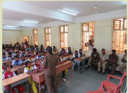
Die Verkehrspolizei erklärt den Kindern die wichtigsten Regeln zur Verkehrssicherheit.

I n Ausgabe 7 des Meilensteins hatten wir geschrieben, dass wir für neue Möbel beten. Die Tische und Bänke, die wir hatten, waren sehr alt und zu wenige. Manche Kinder mussten im Unterricht auf dem Boden sitzen. Als Antwort auf unser Gebet und durch die Zusammenarbeit von Freunden aus Deutschland und der Schweiz war es uns möglich, alle Klassenzimmer in beiden Schulen neu auszustatten. Jetzt können alle Kinder an guten, komfortablen Tischen und Bänken lernen.