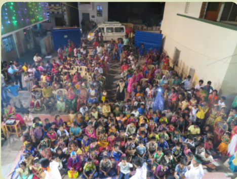
Besucher bei der Weihnachtsfeier der CNPS.