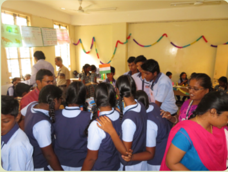
Das Interesse der Schüler an der Wissenschaftsausstellung war groß.