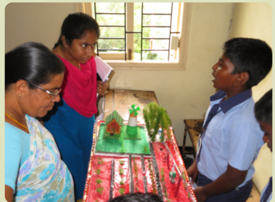
Ein Modell zu regenerativen Energien bei der Wissenschaftsausstellung.

Selig sind die Barmherzigen, denn sie werden Barmherzigkeit erlangen. – Matthäus 5,7